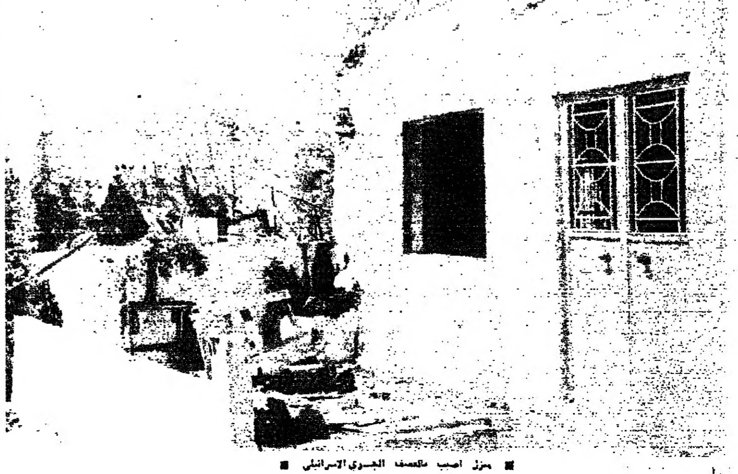
مدرسة اصيب بالدمار الجسدي الاسرائيلي